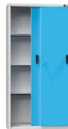
Šířka 1044 mm