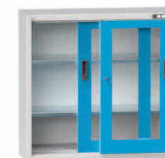
Výška 1000 mm, hloubka 405 mm