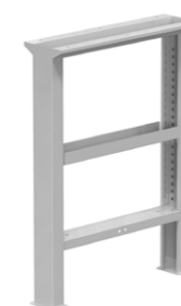
Noha pevná s policí výška 840 mm

Standardní provedení nohy pro základní jednoduché stoly.