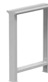
Noha pevná výška 840 mm