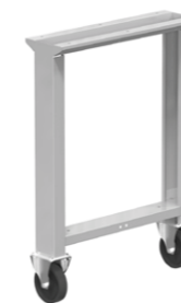
Noha s pevnými koly výška 840 mm

Jednoduchá police, která využívá prostor mezi nohami. Její konstrukce vychází z pevné nohy, pouze vnitřní části jsou vybaveny perforací, která se využije pro výškově stavení police.