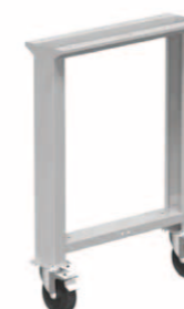
Noha s otočnými koly výška 840 mm

Pevná noha opatřená platí s předvrtanými otvory pro připevnění kol KP 125 mm.